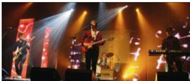
Rindalsbandet Swiks gjorde en solid innsats foran 250 tilhørere i Orkdal Kulturhus.